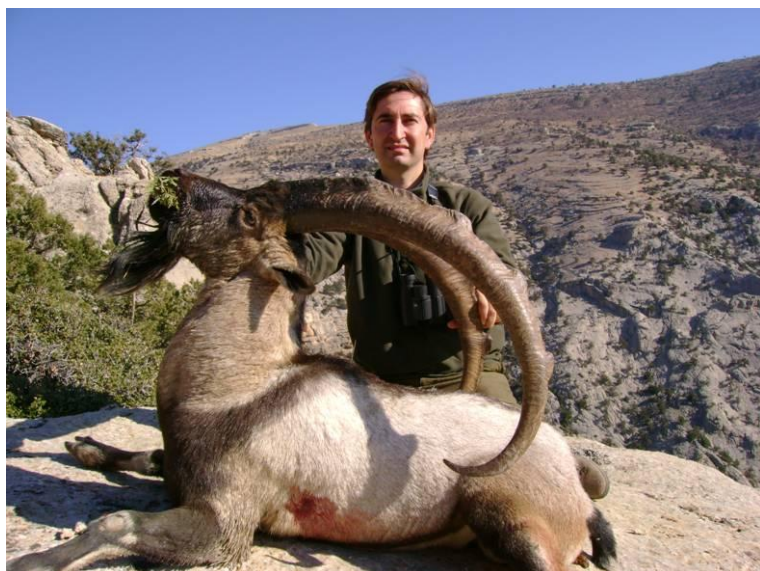
118 cm-es kiváló bezoár

Egyéb, itt nem szabályozott kérdésekben az „Általános Üzleti Feltételek” az irányadók.