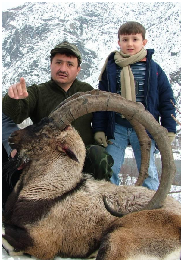
138 cm-es, kapitális bezoár