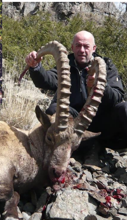
128 és 126 cm-es szibériai kőszáli kecskék