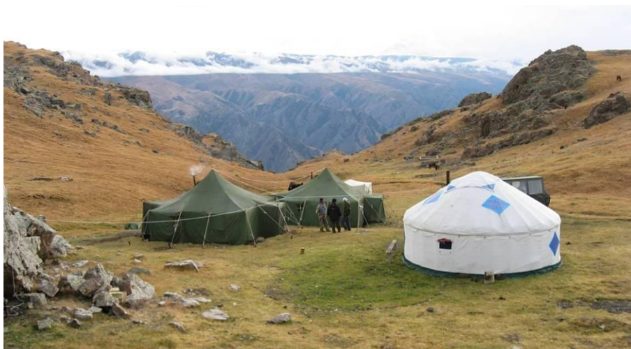
Bázistábor a kőszáli kecske vadászatnál

A koponyákat a területen lefőzik, megtisztítják, a nyakbőröket szakszerűen lenyúzzák, besózzák. A kőszáli kecske és szibériai őz trófeáit a vadászvendég a hazautazásnál hazaviheti magával. A CITES-köteles fajok – farkas, medve – elejtése esetén a szükséges kiviteli okmányok kiállítása időbe telik, ezért ezen fajok trófeái nem vihetők azonnal haza. Ezeket a trófeákat kb. 3 hónappal a vadászatot követően, a vadász költségére fogják hazaküldeni.