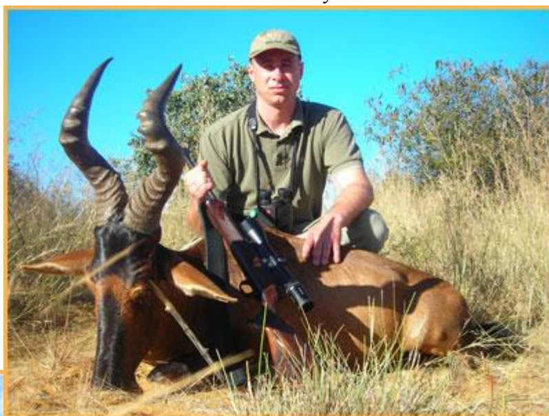
Kiváló tehénantilop terítéken

Lemondás esetén a már befizetett előlegek visszatérítésére nincs lehetőség, azok sztronódíjként kerülnek felszámításra. Ajánlatos ezért az utazásképtelenség eseteire érvényes sztronóbiztosítás, valamint repülőjegy-lemondási biztosítás megkötése. Ezen biztosítások, valamint általános utas (poggyász-, betegség- és baleset-) biztosítás irodánkban megköthetők. Egyéb vonatkozásban az Általános Szerződési Feltételekben leírtak érvényesek.