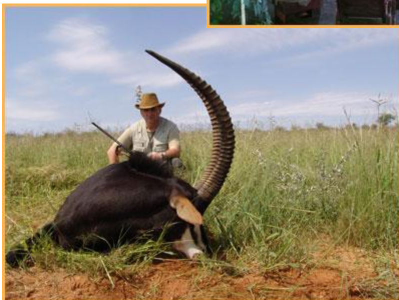
Fekete lóantilop (sable)