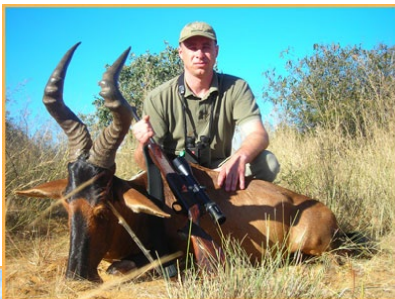
Kiváló tehénantilop terítéken

Lemondás esetén a már befizetett előlegek visszatérítésére nincs lehetőség, azok sztronódíjként kerülnek felszámításra. Ajánlatos ezért az utazásképtelenség eseteire érvényes sztronóbiztosítás, valamint repülőjegy-lemondási biztosítás megkötése. Ezen biztosítások, valamint általános utas (poggyász-, betegség- és baleset-) biztosítás irodánkban megköthetők. Egyéb vonatkozásban az Általános Szerződési Feltételekben leírtak érvényesek.